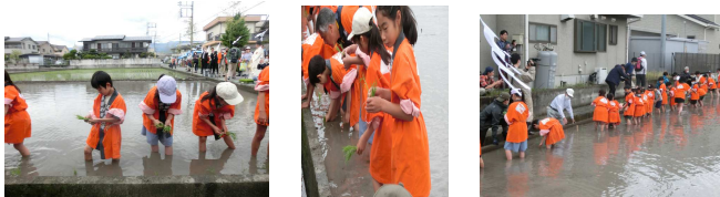
子ども達がお田植えをした後の田んぼです。不揃いなところもまたいいです。👉