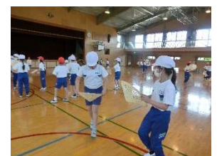
【1・2年生 どんなダンスか楽しみです☺】