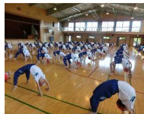
【5・6年生 ブリッジ・逆さ倒立 決まっています!】