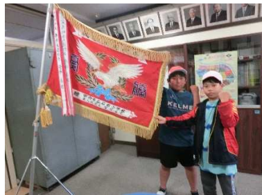
応援団長さんファイト!