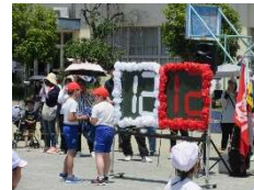
まさに赤も白も良かった！！